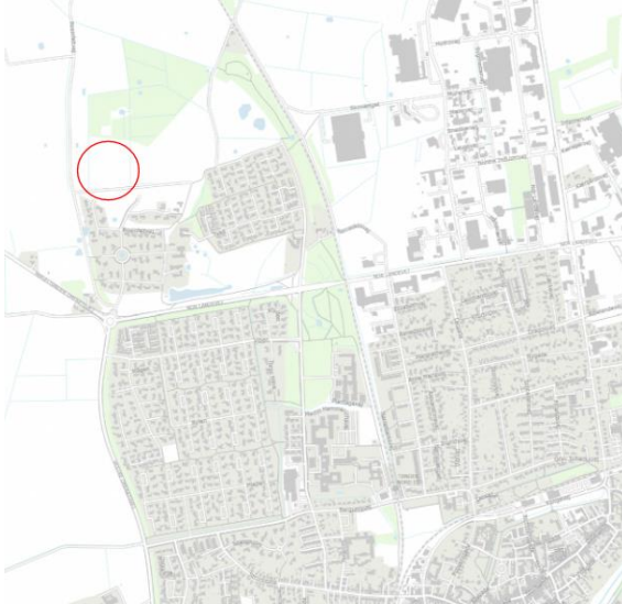
Figur 1 - Kortudsnit fra Danmarks Arealinformation