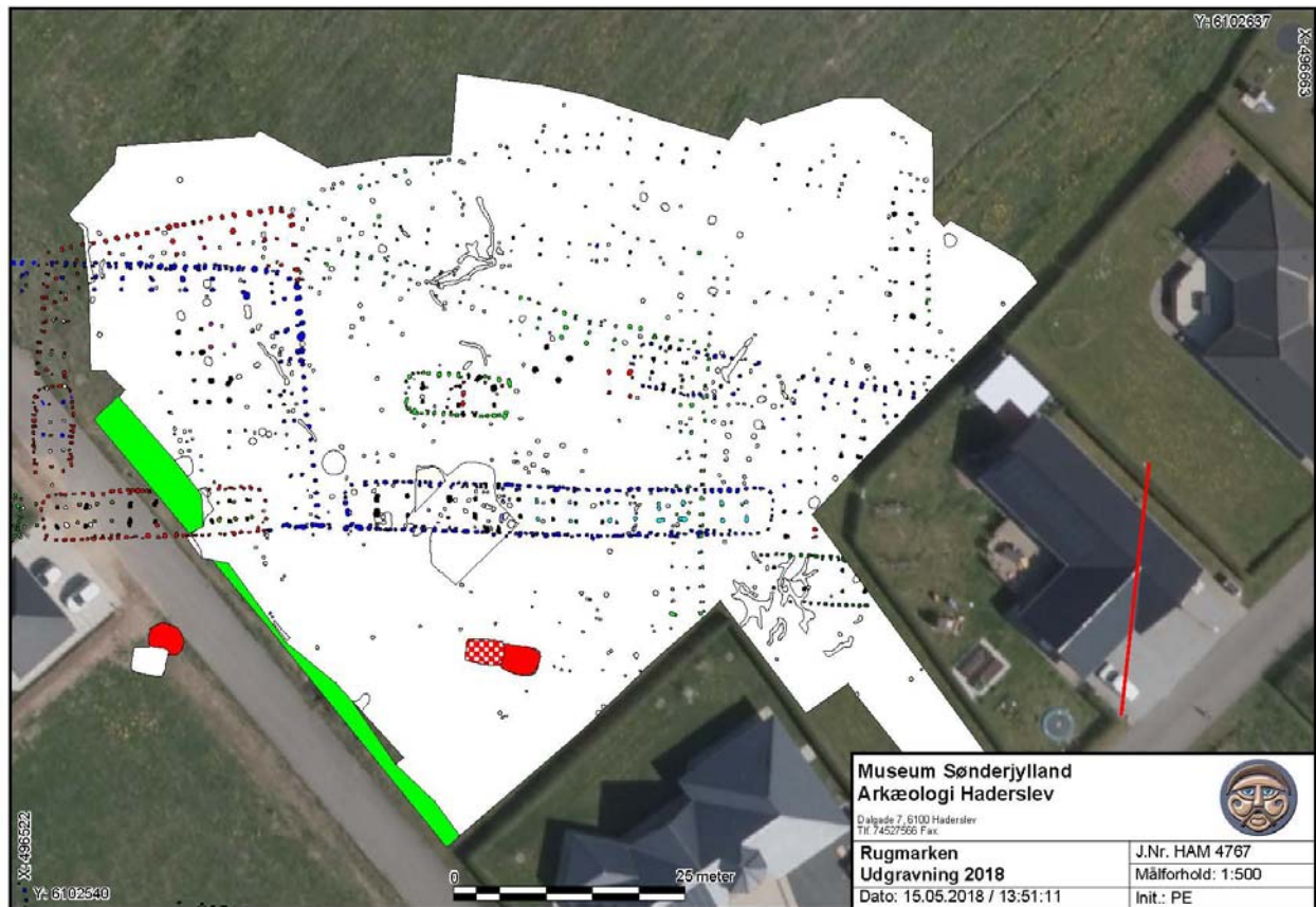
Fig. 1: Oversigt over det udgravede område i 2018 – i alt 5.280 m 2 .

150 år fra sidste halvdel af 300-tallet til begyndelsen af 500-tallet svarende til ældre germansk jernalder.