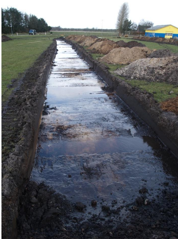
Søgegrøft 2, set fra syd.

I forbindelse med forundersøgelsen blev der ikke påtruffet hverken fund eller anlæg og det må formodes, at der ikke befinder sig væsentlige jordfaste fortidsminder på anlægsarealet.