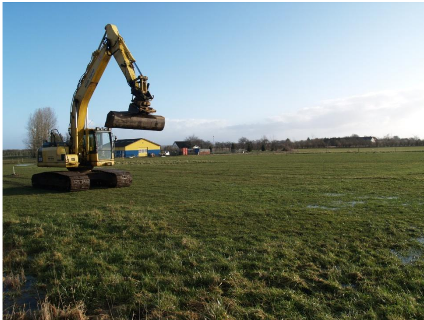
Undersøgelsesområdet ses fra sydvest.

Planområdet ligger i Toftlund bys nordøstlige udkant ved gården Østervang, lige op til en eksisterende erhvervsbebyggelse og på grænsen til åbne landbrugsarealer. På undersøgelsestidspunktet stod arealet hen som græsmark, der blev brugt som hestefold. Terrænet var næsten plant med en svag stigning mod syd. På den nordlige del af arealet stod der vand.