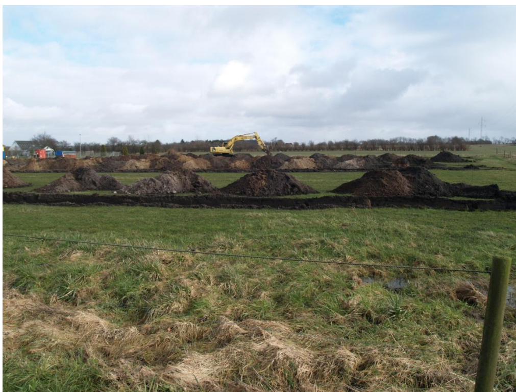
Udsigt over planområdet, efter søgegrøfterne er gravet. Set fra sydvest.