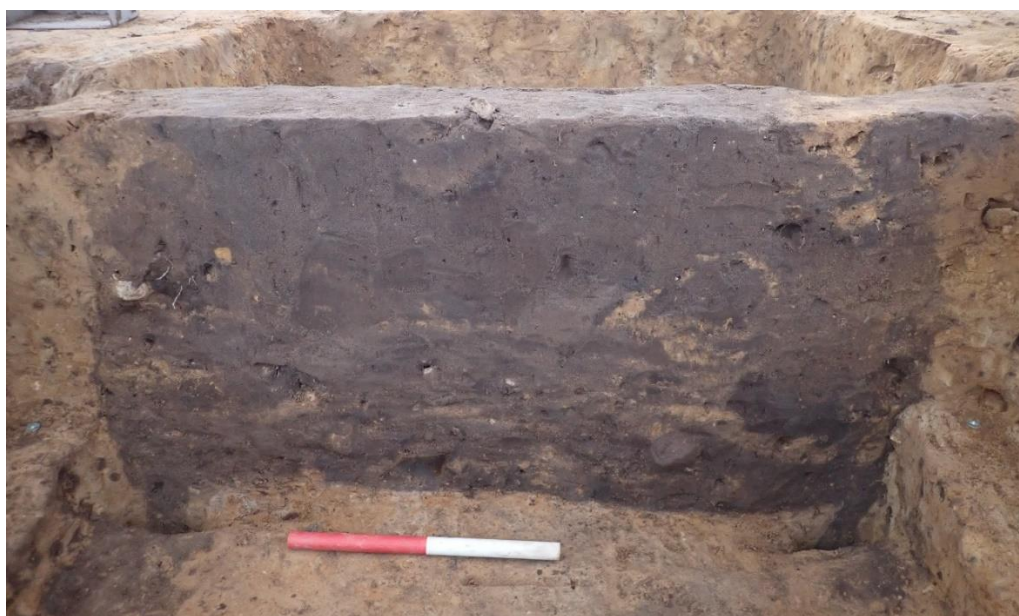
Fig. 3. NØ-profil af balken A21, Grav 1. Set fra NØ. Plankerne i bunden kan ses i hver side. Der er ingen synlige tegn på en kiste, så måske har afdøde været lagt på en seng/klæde/ligbåre i stedet.

Den undersøgte kammergrav var orienteret nordøst-sydvest og ca. 244 x 155 cm. Nedgravningen var ca. 65 cm dyb, havde lodrette sider og flad bund (fig. 3). Langs kanten af graven sås spor efter lodretstående planker, der dannede et næsten rektangulært kammer. Størrelsen på kammeret var ca. 120 x 200 cm. Plankerne viste sig nogle steder at være nedbanket med en dybde af 10-17 cm under gravbundens niveau.