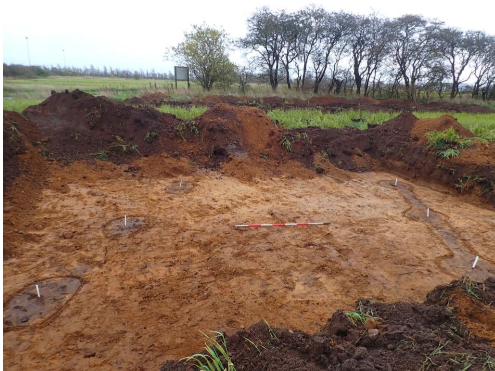
Fig. 5: Resterne af bygningen, som den fremstod ved forundersøgelsen.

Inden for det arkæologiske område er der fundet spor efter en bygning, der dateres typologisk til senmiddelalder/renæssance (fig. 1, 5). Bygningen har været omgivet af et hegn.