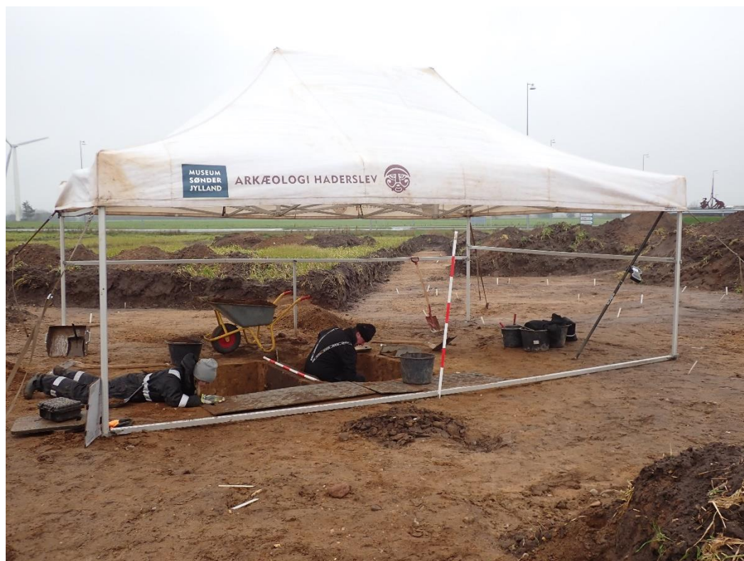
Fig. 4. Arbejdsfoto af udgravningen af A21, Grav 1. Set fra N.

Det arkæologiske område MSJA 30 på matr. 2374 er afgrænset af følgende koordinater (i projektionen UTM32 Euref 89):